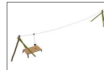
Seilbahn mit Standpodest