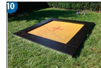
Fun XL Bodentrampolin