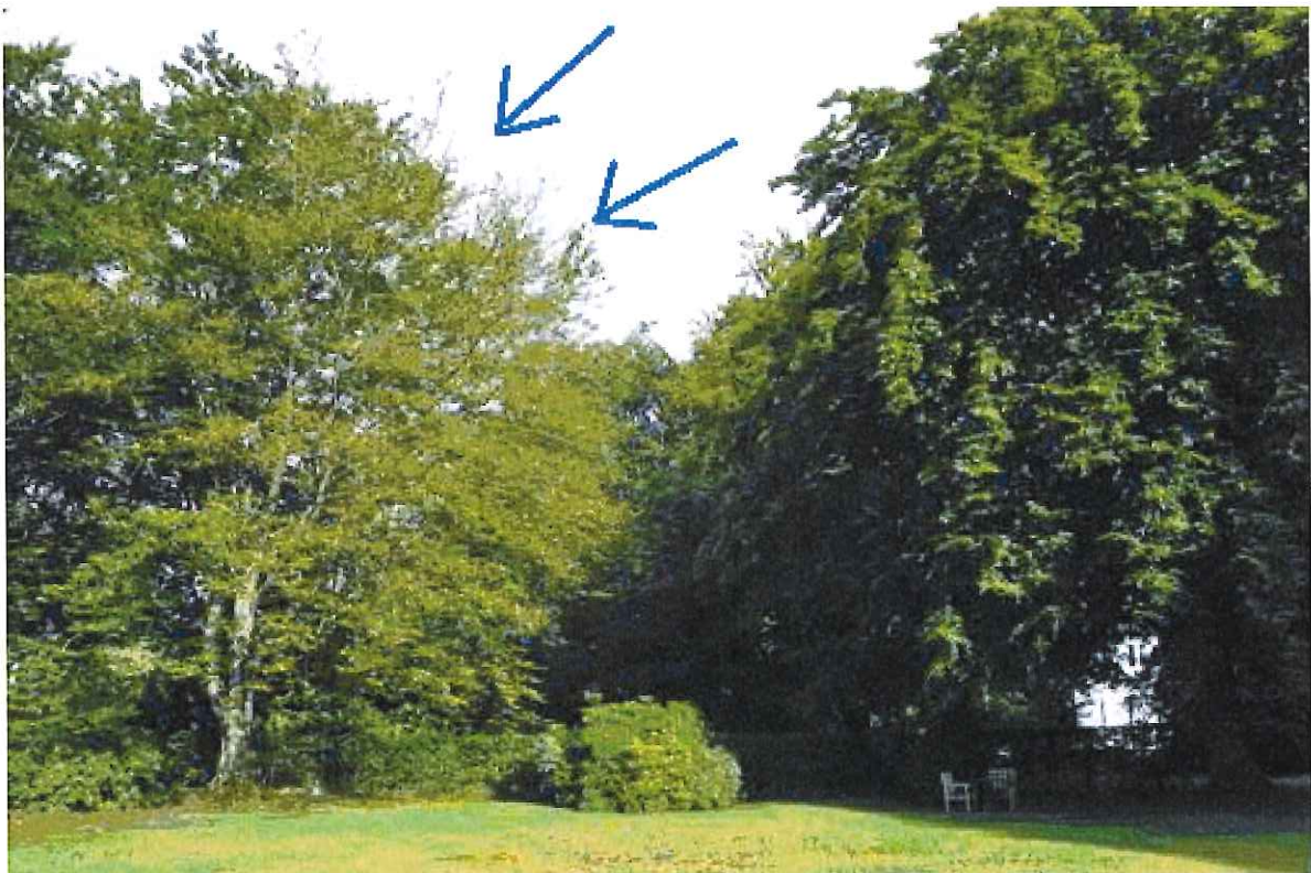
Abb. 2: Buche (links) im Juli 2017 mit verkahlter Krone

Daher beantragen wir die Genehmigung zur sofortigen Fällung des Baumes.