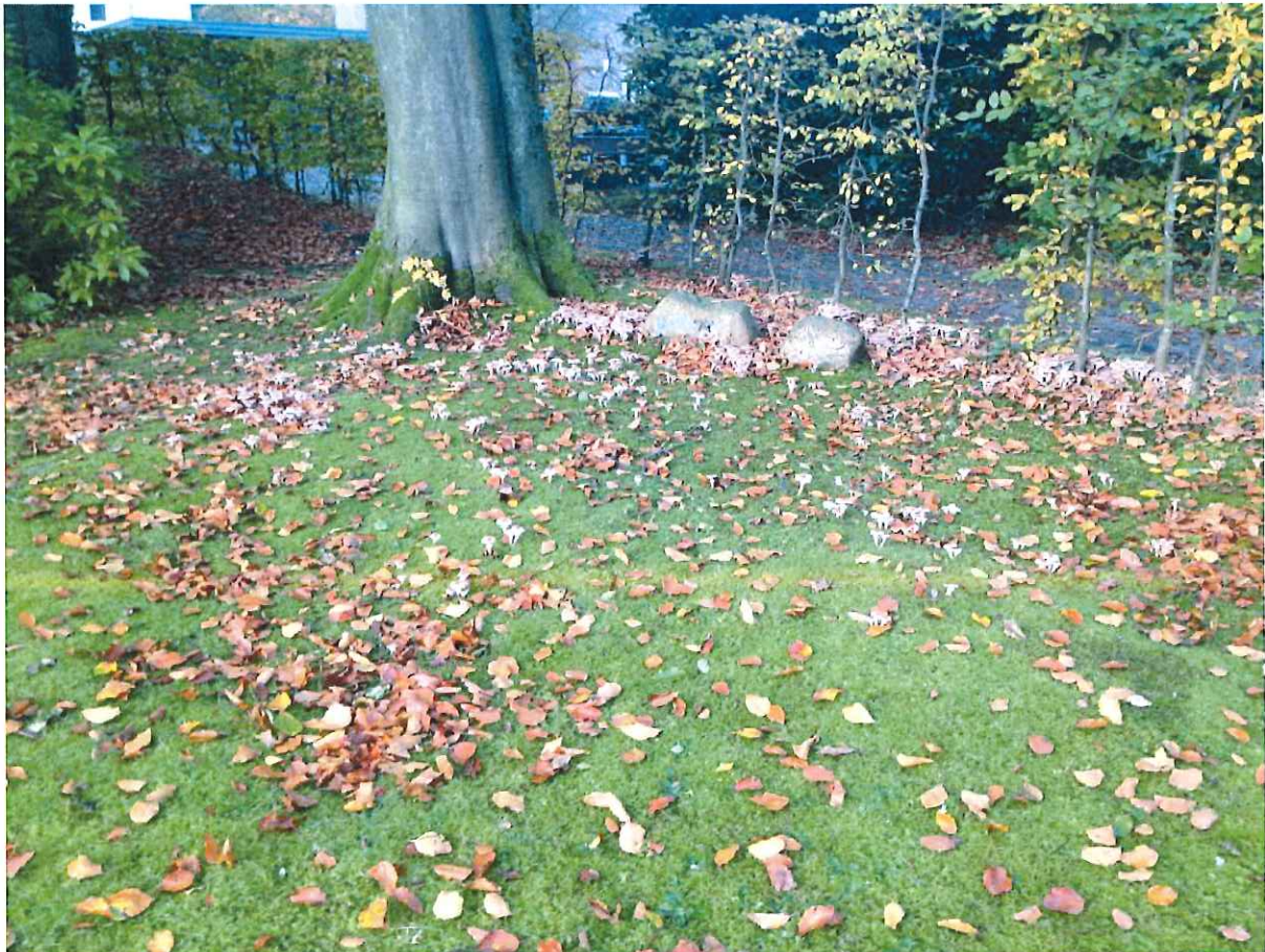
Abb. 5 Hallimaschbefall im gesamten vorderen Wurzelbereich

Wir bitten ferner um die Befreiung von der im B-Plan Nr. 2 vorgesehenen Ersatzpflanzung von zwei Laubbäumen.