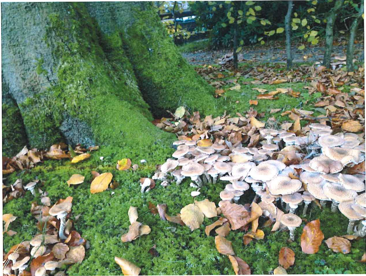
Abb. 3: Hallimaschbefall entlang einer Wurzel