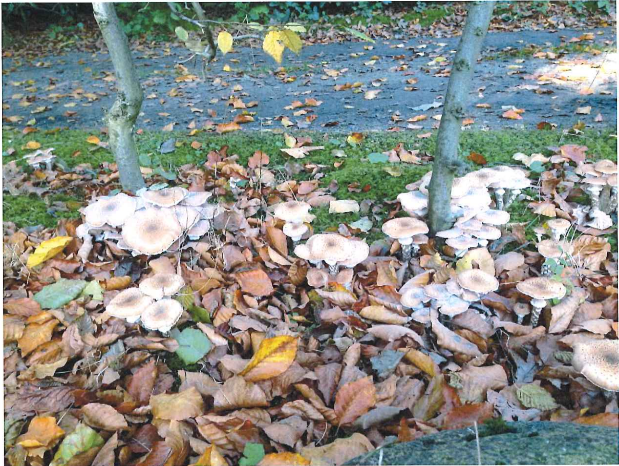
Abb. 4: Hallimaschbefall an benachbarter Buchenhecke